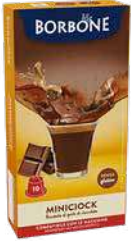
BORBONE CAPSULA NESPRESSO MINICIOCK SIN GLUTEN Y SIN CAFEÍNA 10 pz