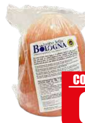
CASA MODENA MORTADELLA BOLOGNA [IGP]