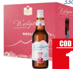
N'ARTIGIANA PACK BIRRA ARTIGIANALE ROSSA 5° 33cl x 12 pz