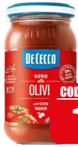
DE CECCO SUGO ALLE OLIVE 200 gr