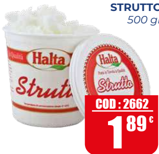
HALTA STRUTTO 500 gr