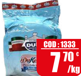
JUPPY PROSCIUTTO COTTO SCELTO "DUKETTO" BOMBATO