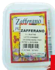
PEZZELLA ZAFFERANO 0,85 gr x 2 u