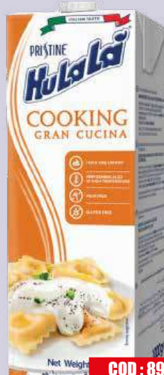
HULALA PANNA GRANCUCINA 1 L