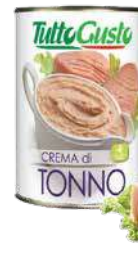
TUTTOGUSTO CREMA TONNO 400 gr