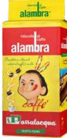
PASSALACQUA CAFFE' ALAMBRA GUSTO PIENO 250 gr