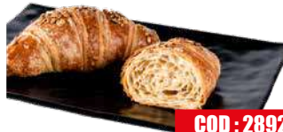
ESPRESSO CORNETTO AI 5 CEREALI 80 gr x 25 pz