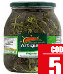
ARTIGIANA SUD FRIARIELLI NAPOLETANI 1 kg