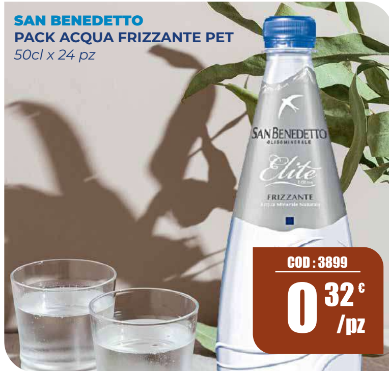
SAN BENEDETTO PACK ACQUA FRIZZANTE PET 50cl x 24 pz