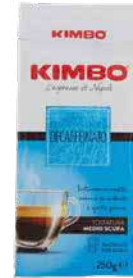
KIMBO CAFFE DECAFFEINADO 250gr