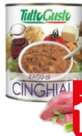
TUTTOGUSTO RAGU DI CINGHIALE 800 gr