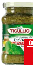
STAR TIGULLIO PESTO GENOVESE S/ AGLIO 190 gr