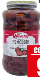
NOVELLA POMODORI SECCHI OLIO GIRASOLE 1,7 kg