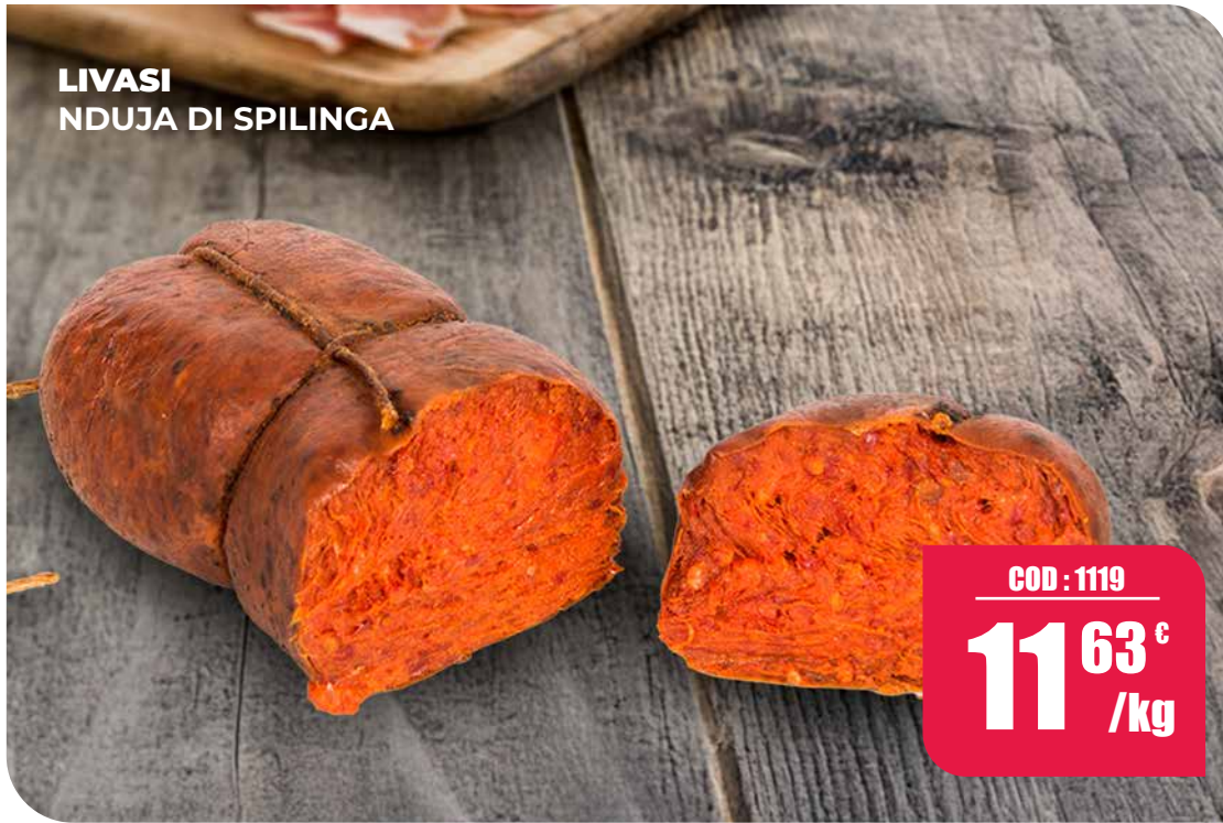
LIVASI NDUJA DI SPILINGA