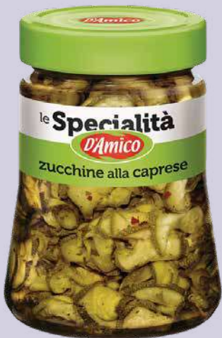
D'AMICO ZUCCHINE ALLA CAPRESE 280 gr