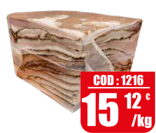
BLU ITALIA SALUMI CICCIOI NAPOLETANI 1/4