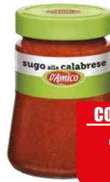
D'AMICO SUGO CALABRESE CON PEPERONCINO 290 gr