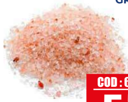
AROMI E SAPORI PT SALE ROSA HIMALAYA GROSSO 850 gr