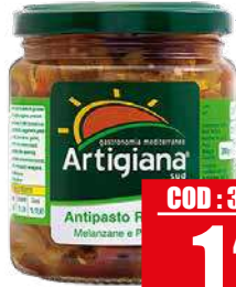
ARTIGIANA SUD ANTIPASTO RUSTICO 280 gr