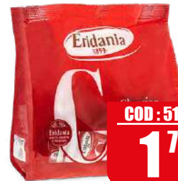
ERIDANIA AZUCAR MONODOSI 500 gr