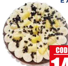
DOLCE FORNO TORTA STRATIFICATA CACAO E ANANAS 1,1 kg