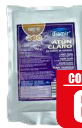
DIAMIR TONNO CLARO TROCITOS ACEITE BOLSA 1 kg