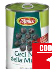
D'AMICO CECI NERI DELLA MURGIA 400 gr