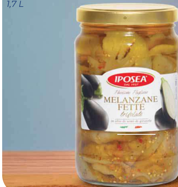
IPOSEA MELANZANE A FILETTI SOTT'OLIO 1,7 L