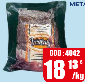
TARITALY SOTTOFESA ALL'INGLESE A META