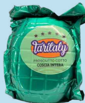
TARITALY PROSCIUTTO COTTO VERDE COSCIA INTERA