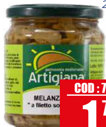
ARTIGIANA SUD MELANZANE A FILETTI 280 gr