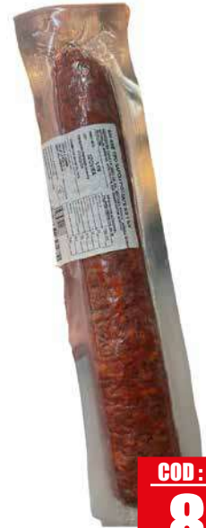
TRINITA SALAME NAPOLETANO PICCANTE