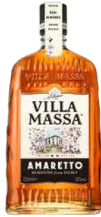
VILLA MASSA AMARETTO 70 cl