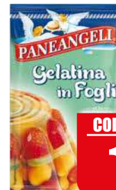
PANEANGELI GELATINA PER DOLCI 12gr