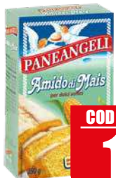
PANEANGELI AMIDO MAIS 250 gr