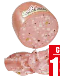
CASA MODENA MORTADELLA AL TARTUFO