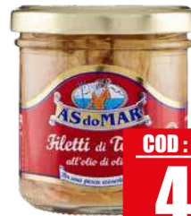
ASDOMAR TONNO A FILETTI IN OLIO D' OLIVA 150 gr