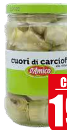
D'AMICO CARCIOFI CUORE RINFUSA 1,6 kg