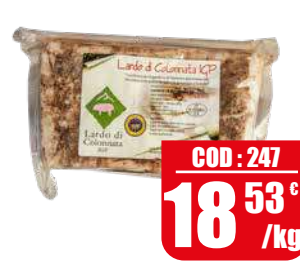
LARDERIA LA REPUBBLICA LARDO DI COLONNATA [IGP]