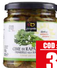
GRANGUSTO CIME DI RAPA 280 gr