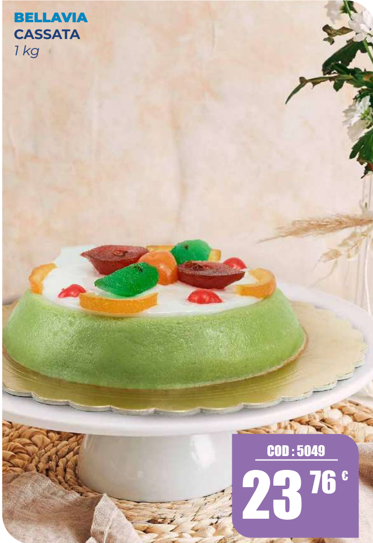
BELLAZIA CASSATA 1 kg