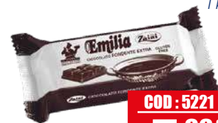
ZAINI EMILIA CIOCCOLATO FONDENTE 50% 1 kg