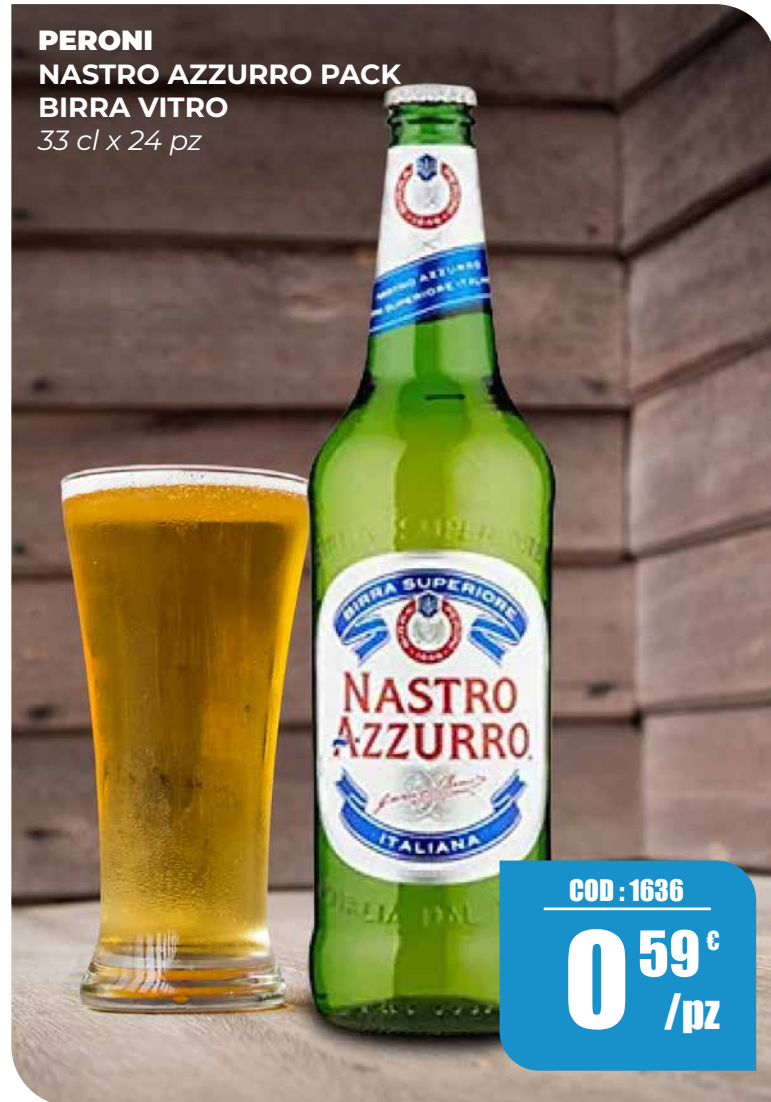
PERONI NASTRO AZZURRO PACK BIRRA VITRO 33 cl x 24 pz