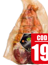
CAVAZZUTI PROSCIUTTO PARMA DISSOTATO 24/M