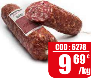
ROSAFINO SALAME NAPOLI DOLCE RISERVA