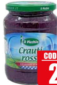
DEVELEY CRAUTI ROSSI IL PICCHIO 720 gr