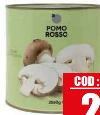
POMOROSSO CARCIOFI A SPICCHI NATURAL 3 kg