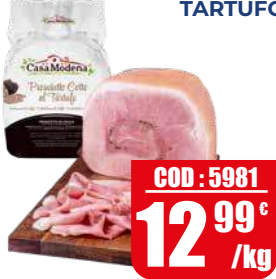
CASA MODENA PROSCIUTTO COTTO AL TARTUFO