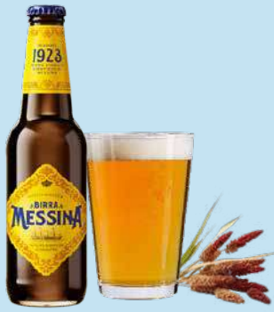
MESSINA PACK BIRRA 33 cl x 24 pz