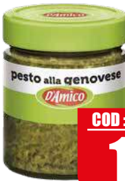
D'AMICO PESTO ALLA GENOVESE 130 gr