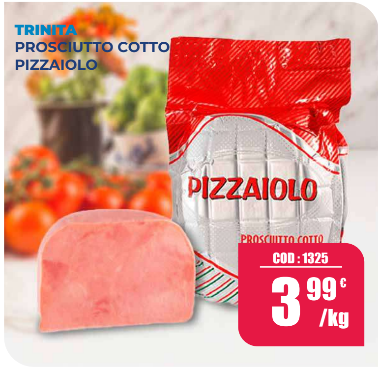
TRINITA PROSCIUTTO COTTO PIZZAIOLO