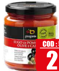
GRANGUSTO SUGO POMODORO OLIVE E CAPPERI 290 gr