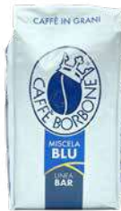
BORBONE GRAN BAR BLU GRANI 1 kg