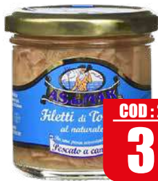
ASDOMAR TONNO A FILETTI AL NATURALE 150 gr