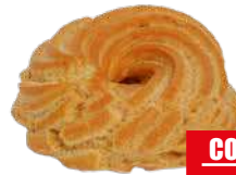
ESPRESSO ZEPPOLE FRITTE 80 gr x 25 pz