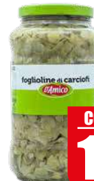
D'AMICO FOGLIOLINE DI CARCIOFI 2,9 kg