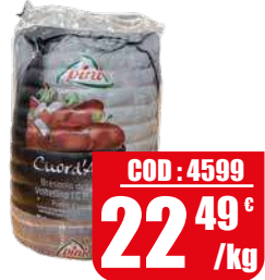
PINI BRESAOLA DELLA VALTELLINA [IGP] 1/2