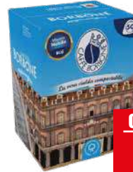
BORBONE PACK CIALDA BLU 50 pz