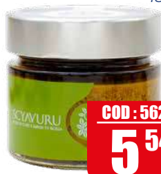
SCYAVURU PESTO AL PISTACCHIO 60 180 gr