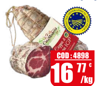
CASA MODENA COPPA DI PARMA [IGP]