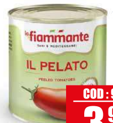
LA FIAMMANTE POMODORI PELATI 2,5 kg