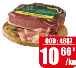
SENFTER SPECK MONTAGNA 1/2