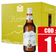
N'ARTIGIANA PACK BIRRA ARTIGIANALE ORO LAGER 4,8° 33cl x 12 pz