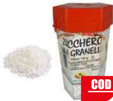
PEZZELLA ZUCCHERO GRANELLI 100 gr