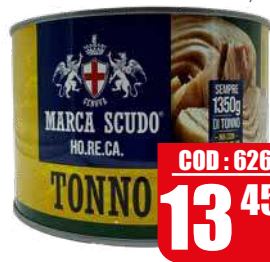
SCUDO HO.RE.CA TONNO TRANCIO O/OLIVA 1,63 kg