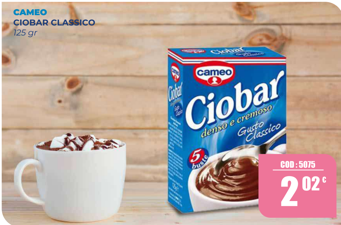
CAMEO CIOBAR CLASSICO 125 gr