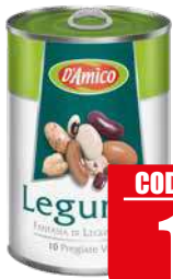
D'AMICO FAGIOLI LEGUMIX 400 gr