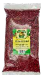
AROMI E SAPORI PEPE ROSA SECCO IN GRANI 500 gr