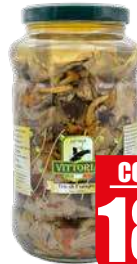
VITTORIA TRIS FUNGHI OLIO 3 kg