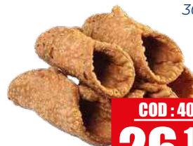
PAGEF PACK CIALDA CANNOLI MIGNON 300 pz