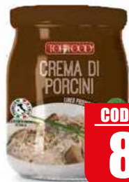
TOPFOOD CREMA PORCINI 520 gr