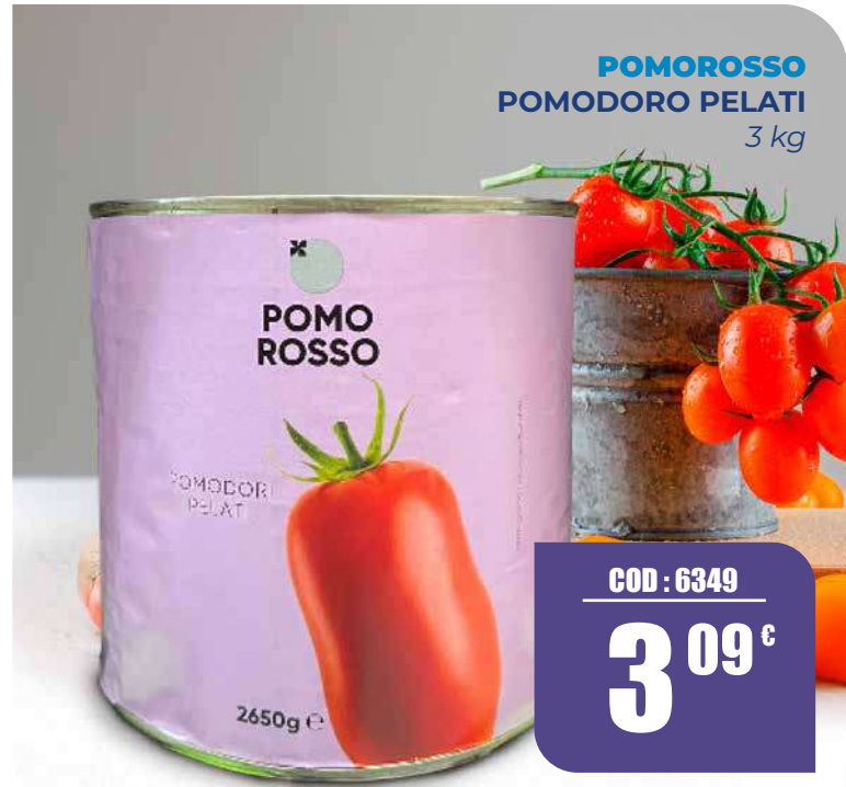
POMOROSSO POMODORO PELATI 3 kg