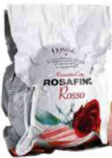
ROSAFINO PROSCIUTTO COTTO