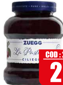
ZUEGG MARMELLATA CILIEGIA 700 gr