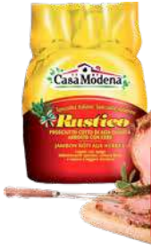
CASA MODENA PROSCIUTTO COTTO ERBE RUSTICO