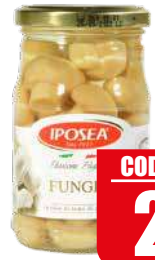
IPOSEA FUNGHI SOTT' OLIO 314 ml