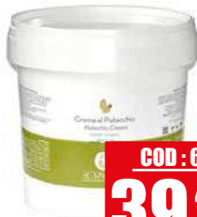
SCYAVURU CREMA PISTACCHIO 18% 3 kg