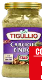
STAR TIGULLIO PESTO CARCIOFI E NOCI 190 gr