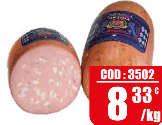
LEONCINI MORTADELLA OPTIMA C/ PISTACCHIO