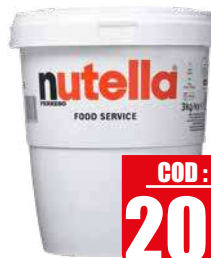
FERRERO NUTELLA 3 kg