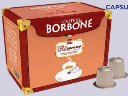
BORBONE CAPSULA NESPRESSO NERA 100 pz