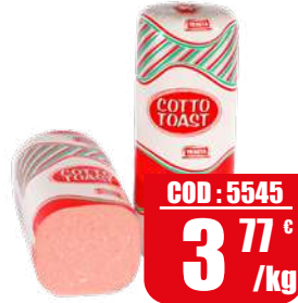
TRINITA PROSCIUTTO COTTO TOAST