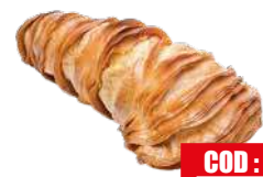
BELLAZIA CODA D'ARAGOSTA 7 kg