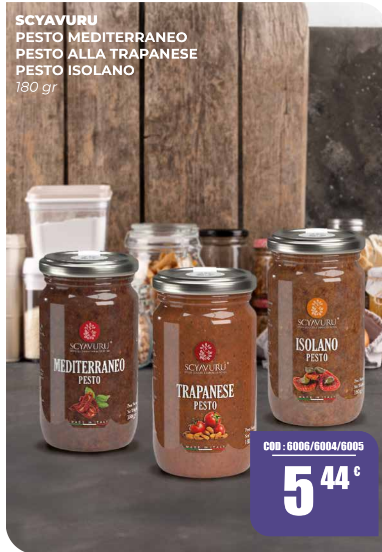
SCYAVURU PESTO MEDITERRANEO PESTO ALLA TRAPANESE PESTO ISOLANO 180 gr