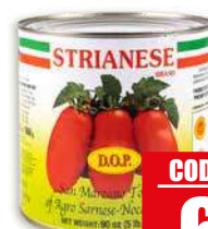
STRIANESE POMODORO SAN MARZANO DOP 2,5 kg