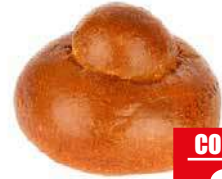
ESPRESSO PACK BRIOCHE COL TUPPO 15 pz