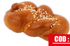
ESPRESSO PACK BRIOCHE A TRECCIA 20 pz