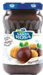
SANTAROSA CASTAGNE DELIZIE CONFETTURA 350 gr