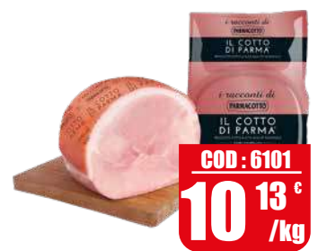
PARMACOTTO COTTO PARMACOTTO