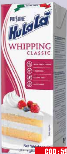
HULALA PANNA CLASSICA 1 L