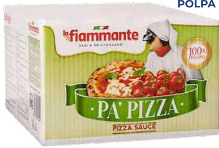
LA FIAMMANTE POLPA POMODORI BAG IN BOX 5 kg