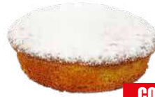
ESPRESSO CAPRESINA AL LIMONE 75 gr x 25 pz