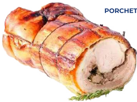
DENTICO PORCHETTA DI ARICCIA [IGP]