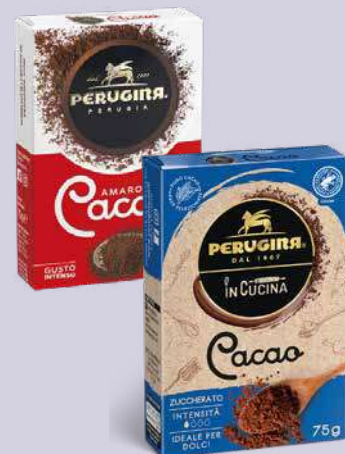
PERUGINA CACAO AMARO CACAO DOLCE 75 gr