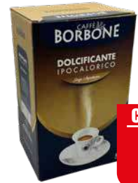
BORBONE PACK MASTER DOLCIFICANTE 240 pz