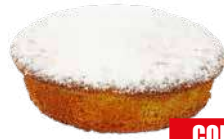
ESPRESSO CAPRESINA 80 gr x 25 pz