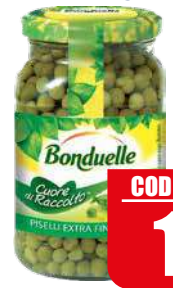
BONDUELLE PISELLI EXTRA 580 gr