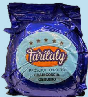
TARITALY PROSCIUTTO COTTO BLU GRAN COSCIA GENUINO