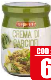
TOPFOOD CREMA CARCIOFI 520 gr