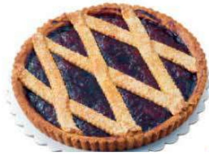
EFFEPI CROSTATA AMARENA PRETAGLIATA