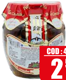
BELLA CONTADINA POMODORI SECCHI 314 gr