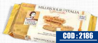
MATILDE VICENZI MILLEFOGLIE GLASSATE 125 gr