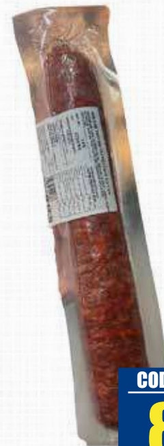
TRINITA SALAME NAPOLETANO PICCANTE