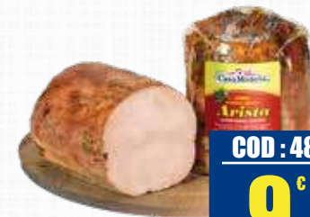
CASA MODENA ARISTA 1/3