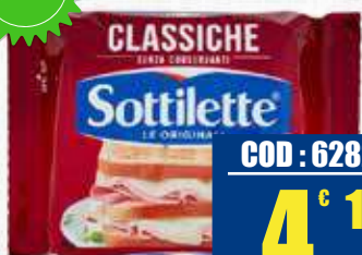
SOTTILETTE CLASSICHE 400 gr