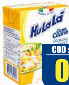
HULALA PANNA GRANCUCINA 200 ml