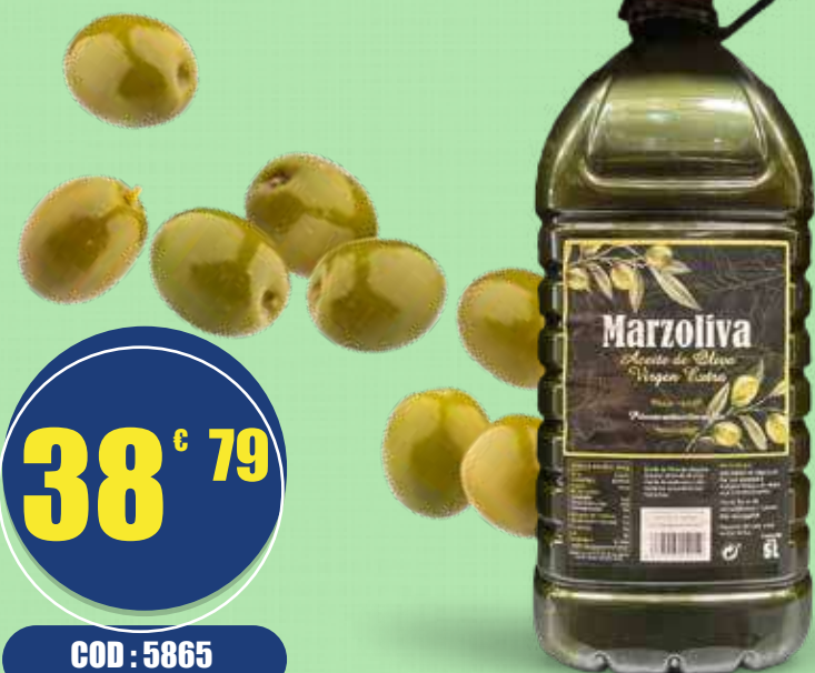
MARZOLIVA OLIO OLIVA EXTRA VERGINE 5 L