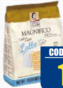
MATILDE VICENZI MAGNIFICO WAFER LATTE CUBETTI 125 gr