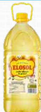
GUISOL OLIO GIRASOLE 5 L