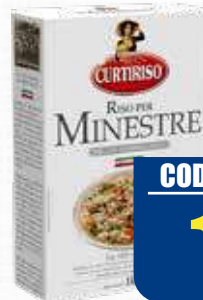
CURTIRISO MINESTRE 1 kg