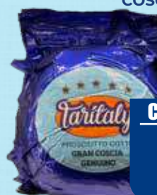
TARITALY PROSCIUTTO COTTO BLU GRAN COSCIA GENUINO