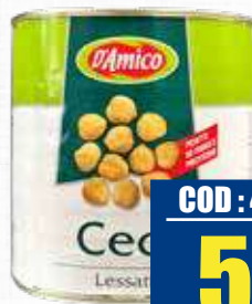
D'AMICO CECI 2,5 kg