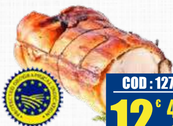
DENTICO PORCHETTA DI ARICCIA [IGP]