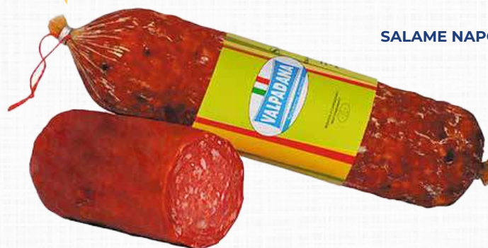
TRINITA SALAME NAPOLETANO DOLCE