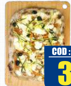
LALTRA PIZZA PINSA MAXI 37x28 CM 450 gr