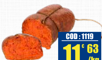
LIVASI NDUJA DI SPILINGA