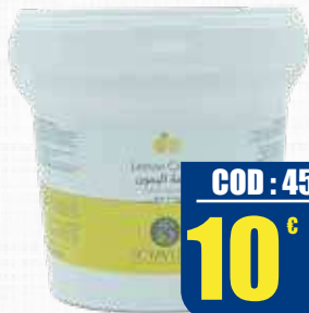
SCYAVURU CREMA AL LIMONE 1 kg