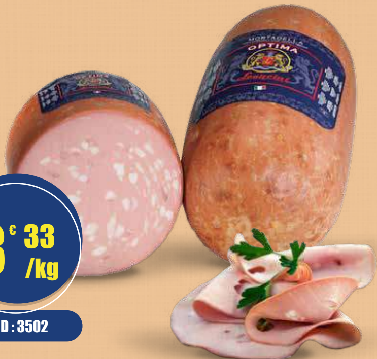
LEONCINI MORTADELLA OPTIMA C/PISTACCHIO