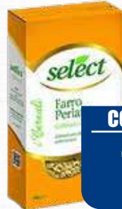
SELECT FARRO PERLATO 400 gr