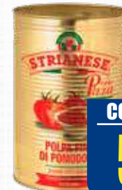
STRIANESE POLPA DI POMODORO 4 kg