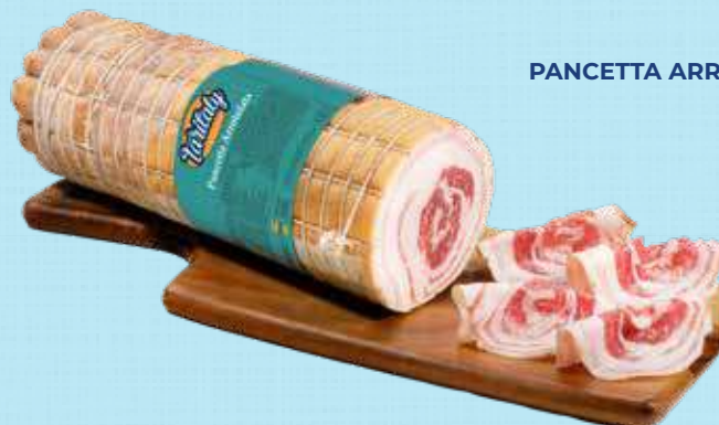
TARITALY PANCETTA ARROTOLATA SENZA COTENNA