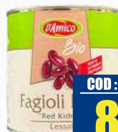
D'AMICO FAGIOLI RED KINDLEY BIO 2,5 kg