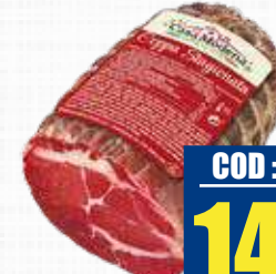
CASA MODENA COPPA PELATA 1/2