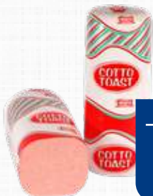
TRINITA PROSCIUTTO COTTO TOAST