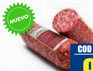
ROSAFINO SPIANATA PICCANTE RISERVA