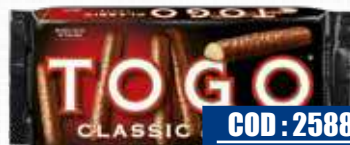
PAVESI TOGO CLASSICO LATTE 120 gr