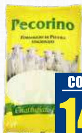
PINNA PECORINO GRATTUGIATO 1 kg