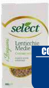
SELECT LENTICCHIE MEDIE 400 gr