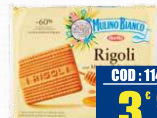
MULINO BIANCO RIGOLI 800 gr