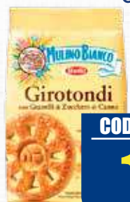
MULINO BIANCO GIROTONDI 350 gr