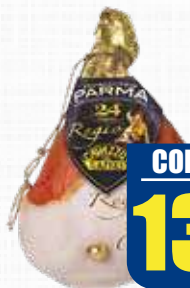
CAVAZZUTI PROSCIUTTO PARMA 24 MESI CON OSSO