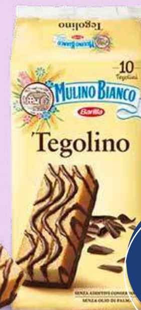
MULINO BIANCO TEGOLINO CLASSICO 350 gr