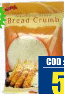
N-YOTO PANKO 1 kg