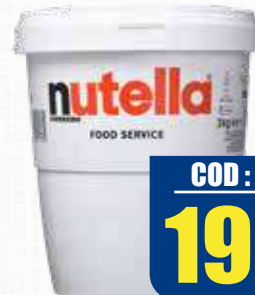
FERRERO NUTELLA 3 kg