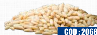
MARNUTS PINOLI SGUSCIATI MEDITERRANEI 1 kg