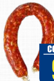
TRINITA SALSICCIA NAPOLI PICCANTE