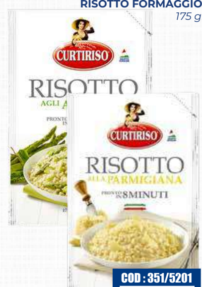
CURTIRISO RISOTTO ASPARAG RISOTTO FORMAGGI 175 gr