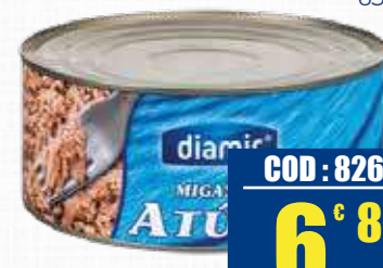
DIAMIR TONNO OLIO GIRASOLE LATTA 650 gr