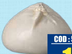
TARITALY BURRATA SENZA TESTA 100 gr