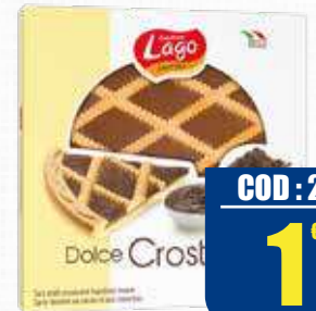
LAGO CROSTATA CACAO 350 gr