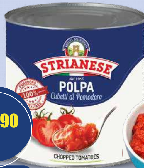
STRIANESE POLPA A DADINI 2,5 kg