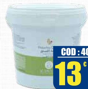
SCYAVURU CREMA PISTACCHIO 15% 1 kg