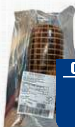
TRINITA PANCETTA ARROTOCATA AL PEPE