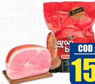
ROVAGNATI PROSCIUTTO GRANBISCOTTO