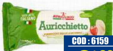
AURICCHIO SALAMINO AURICCHIETTO 270 gr