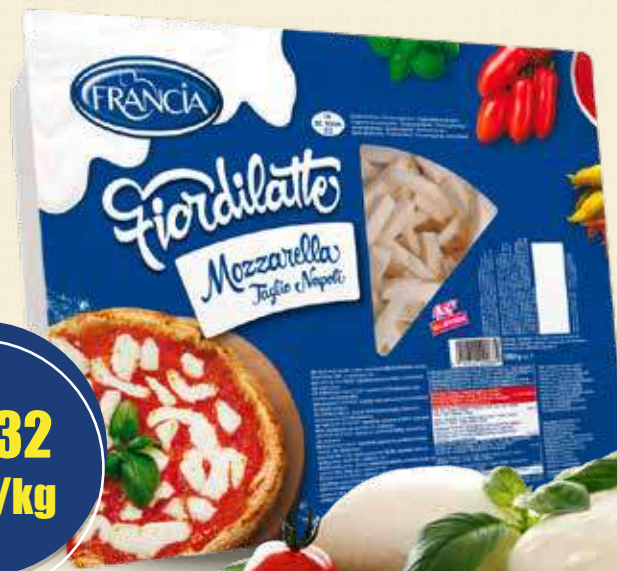
FRANCIA MOZZARELLA FIOR DI LATTE 3 kg