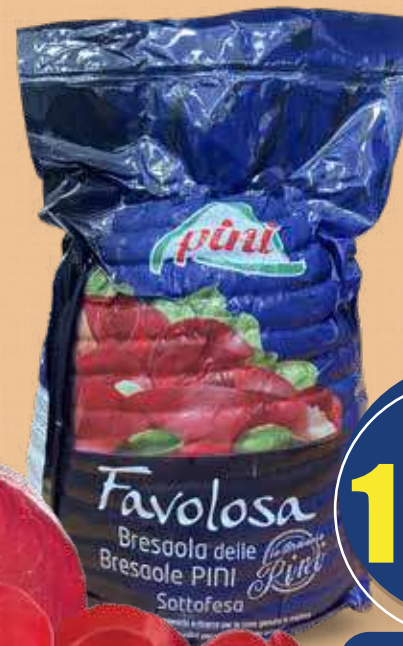
PINI BRESAOLA SOTTOFESA FAVOLOSA 1/2