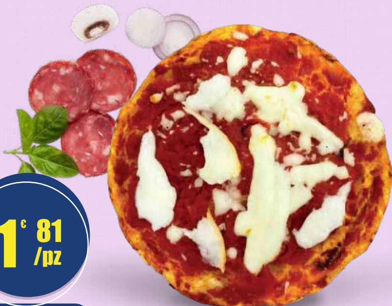
ABBONDANZA PACK PIZZA MONTANARA 30 pz