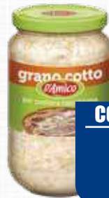
D'AMICO GRANO COTTO 580 gr