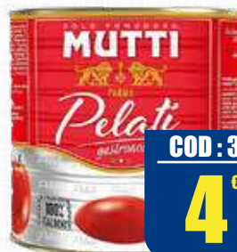
MUTTI PELATI GASTRONOMIA 2,5 kg