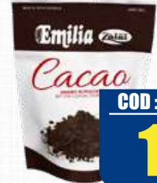
ZAINI CACAO AMARO 150 gr