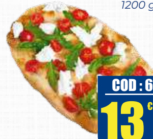
LALTRA PIZZA PACK PINSA IN TEGLIA 60 X 40 CM 1200 gr x 2 pz