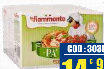
LA FIAMMANTE POLPA POMODORI BAG IN BOX 5 kg