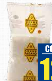
COLLA GRANA PADANO GRATTUGIATO 1 kg