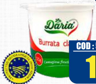
LA DARIA BURRATA [IGP] SENZA TESTA VASETTO 125 gr