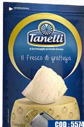
TANELLI FORMAGGIO MIX GRATTUGIATO 500 gr