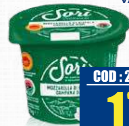
SORI MOZZARELLA BUFALA [DOP] VASETTO 125 gr