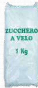
PEZZELLA ZUCCHERO A VELO 1 kg