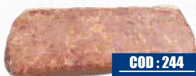
ELAN FOODS BACON ARTIGIANALE SENZA COTENNA