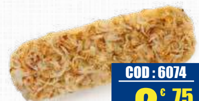
FRANCONE LINGUA CIPOLLA 340 gr x 10 pz