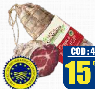
CASA MODENA COPPA DI PARMA [IGP]