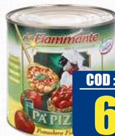
LA FIAMMANTE POLPA "PA PIZZA" 4 kg