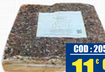
LARDERIA LA REPUBBLICA LARDO IN CONCA