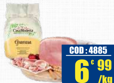
CASA MODENA PROSCIUTTO COTTO GRANROSA