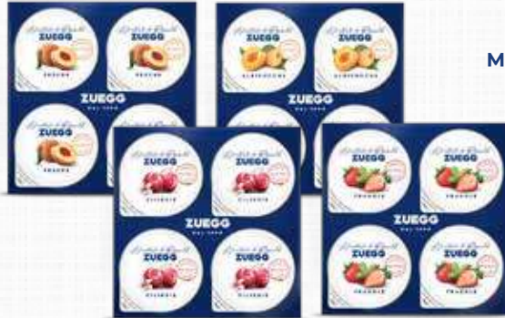
ZUEGG MERMELADA PESCA T90 MERMELADA ALBICOCCA T90 MERMELADA CILIEGIA T90 MERMELADA FRAGOLA T90 25 gr