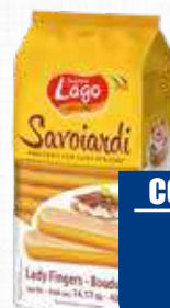
LAGO SAVOIARDI 400 gr