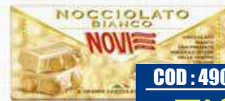
NOVI PACK TAVOLETTA NOCIOLATTO BIANCO 130 gr x 3 pz