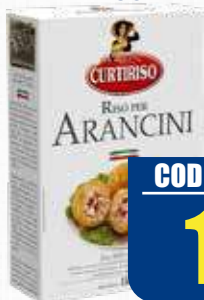
CURTIRISO RISO PER ARANCINI 1 kg