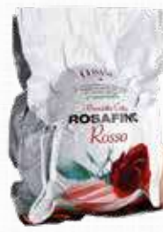
ROSAFINO PROSCIUTTO COTTO