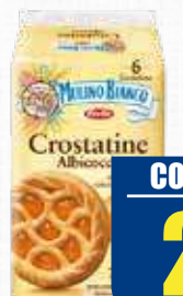
MULINO BIANCO CROSTATINA ALBICOCCA 400 gr