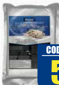
DIAMIR MIGAS ATUN BONITO BOLSA 1 kg