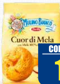
MULINO BIANCO CUOR DI MELA 250 gr