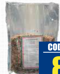
MARNUTS GRANELLA NOCCIOLA 500 gr