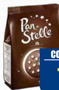
MULINO BIANCO PAN DI STELLE 350 gr