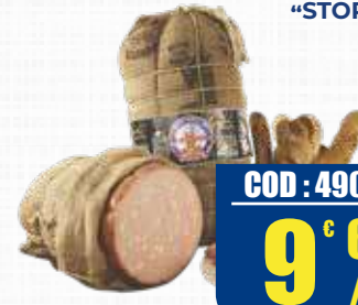
ALCISA MORTADELLA GOLD PISTACCHIO "STORICA"