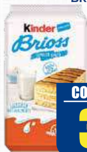
KINDER BRIOSS LATTE 270 gr