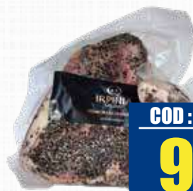
IRPINIA GUANCIALE STAGIONATO AL PEPE