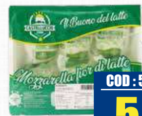
CASTELLUCCIO FIOR DI LATTE PIZZA EU 3 kg