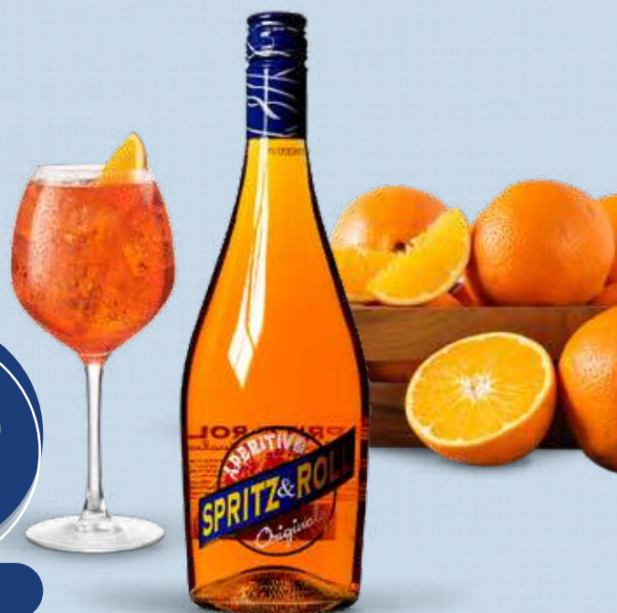
CALDIROLA APERITIVO SPRIZ & ROLL 8% 75 cl