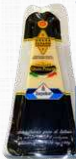
ZARPELLON GRANA PADANO 200 gr