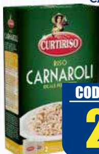
CURTIRISO CARNAROLI 1 kg