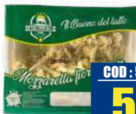
CASTELLUCCIO MOZZARELLA JULIENNE TAGLIO NAPOLI 3 kg