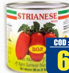
STRIANESE POMODORO SAN MARZANO 2,5 kg