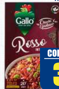
GALLO RISO ROSSO 500 gr