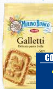
MULINO BIANCO GALETTI 350 gr