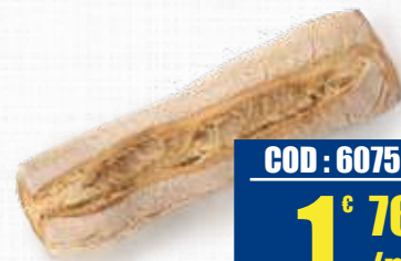
FRANCONE SFILATONE GRANO DURO 300 gr x 15pz