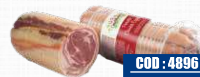
CASA MODENA PANCETTA COPPATA CLASSICA