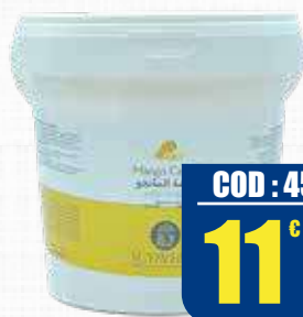
SCYAVURU CREMA AL MANGO 1 kg