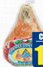
ERMES FONTANA PROSCIUTTO STAGIONATO NAZIONALE RIVIERA