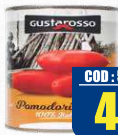
GUSTAROSSO POMODORI PELATI 100% ITALIANA 2,5 kg