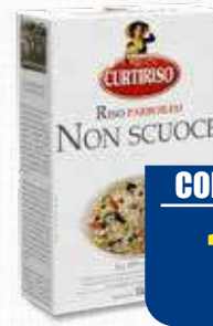
CURTIRISO NON SCUOCE 1 kg