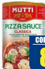
MUTTI POLPA SAUCE TOMATE 4,1 kg