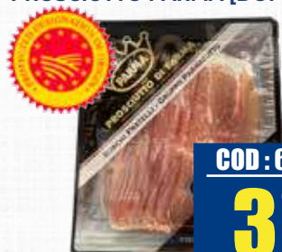
PARMACOTTO PROSCIUTTO PARMA [DOP] 100 GR