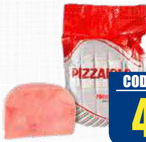
TRINITA PROSCIUTTO COTTO PIZZAIOLO