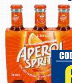
APEROL SPRITZ 3 IN PAC 9% 20 cl