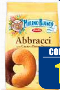
MULINO BIANCO ABBRACCI 350 gr