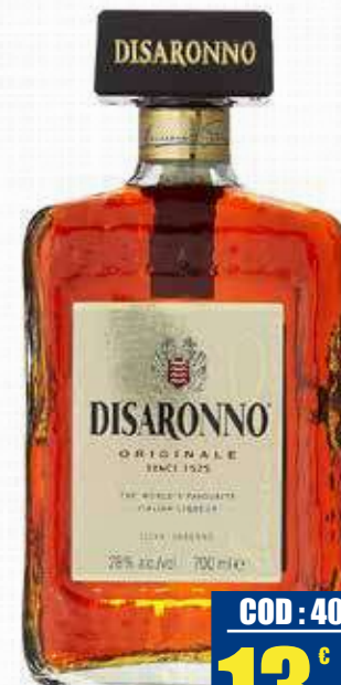
DISARONNO AMARETTO DI SARONNO 28% 70 cl