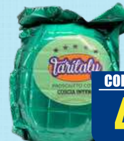
TARITALY PROSCIUTTO COTTO VERDE COSCIA INTERA