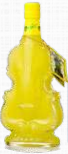
DESIRE LIMONCELLO FANTASIA 25% 50 cl