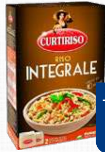
CURTI CURTI INTEGRALE 500 g