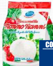
NONNO NANNI MOZZARELLA 125 g