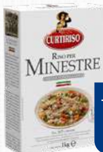
CURTI CURTIRISO PER MINESTRE 1 Kg