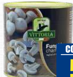
VITTORIA CHAMPIGNONES AL NATURALE 2,5 Kg