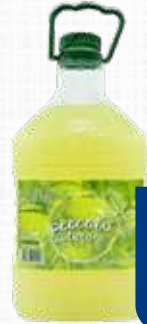
LIMONCELLO PECCATO DI LIMONE 25% 3 l