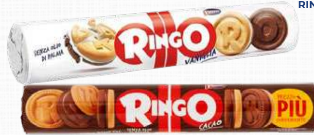
PAVESI RINGO TUBO VANIGLIA/ RINGO TUBO CACAO 165 g