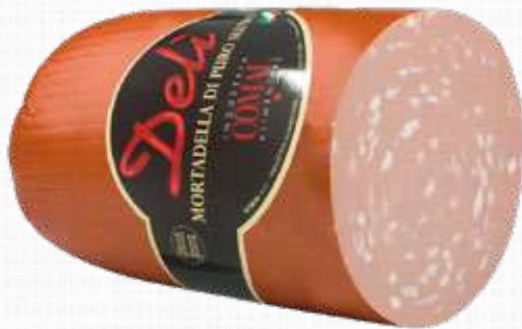
COMAL MORTADELLA DELI' CON PISTAC- CHIO