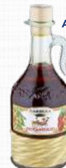
BARBERA EXTRA VERGIN OLIO AROMA PICCANTOLIO 500 ml