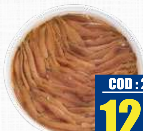
BELLAMAR FILETTI DI ACCIUGHE 700 g