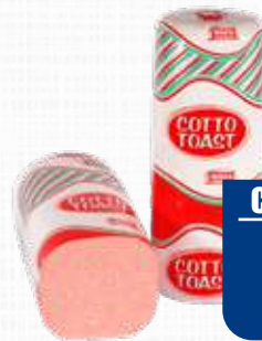
TRINITA PROSCIUTTO COTTO TOAST