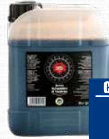
ANDREA MILANO ACETO BALSAMICO 5 L 5 L