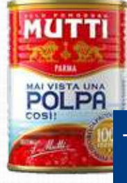
MUTTI POLPA DI POMODORO 4 Kg