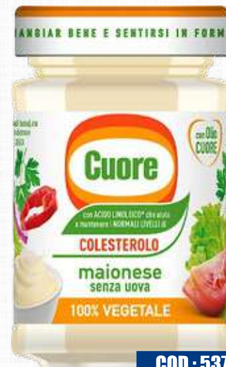
CUORE MAIONESE 100% VEGETALE SENZA UOVA