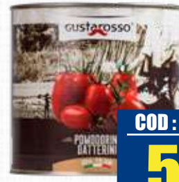
GUSTAROSSO POMODORO DATTERINO 2,5 Kg