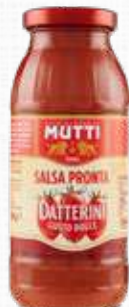
MUTTI SALSA PRONTA DATTERINI 300 g