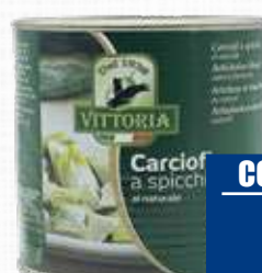
VITTORIA CARCIOFI A SPICCHI AL NATURALE 2,5 Kg