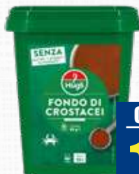
HUGLI FONDO CROSTACEI "SENZA-ZIONALE" 650 g