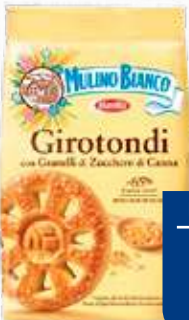
MULINO BIANCO GIROTONDI 350 g