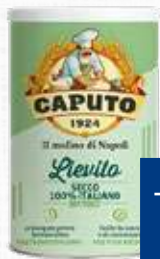
CAPUTO LIEVITO SECCO 100 g