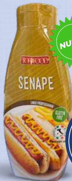
TOP SALSA SENAPE 1,07 Kg