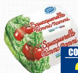
NONNO NANNI SQUAQUERELLO 125 g