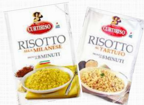
CURTI RISOTTO MILANESE/ RISOTTO TARTUFO 175 g