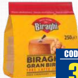
BIRAGHI BIRAGHINI 250 g