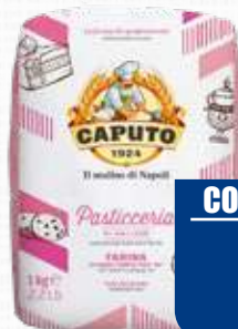
CAPUTO FARINA PASTICCERIA 1 Kg