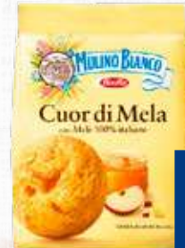
MULINO BIANCO CUOR DI MELA 250 g