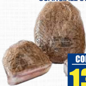
LARDERIA GUANCIALE STAGIONATO