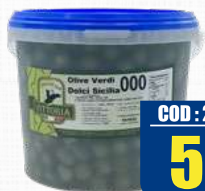
VITTORIA OLIVA VERDE SICILIA 000 5 Kg