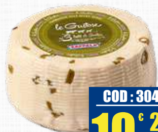
ZAPPALA LE GUSTOSE CON OLIVE VERDI 800 g