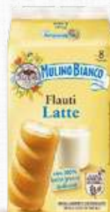
MULINO BIANCO FLAUTI LATTE 280 g