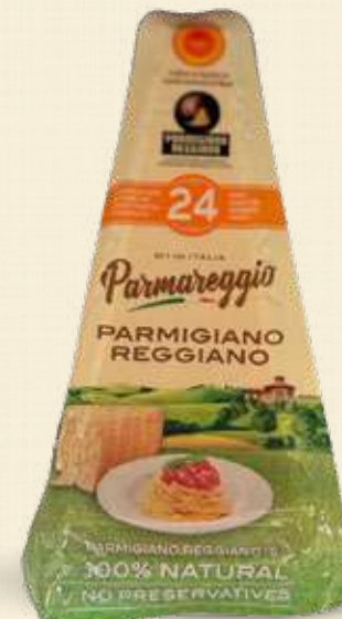
PARMAREGGIO PARMIGIANO 24 M. 150 g