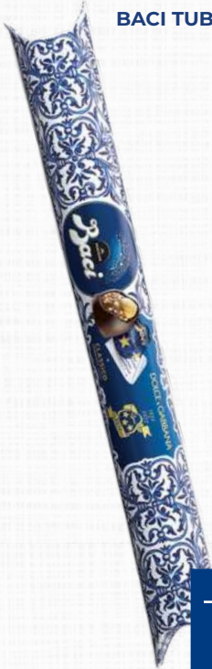
PERUGINA BACI TUBO ILLUSTRATO 125 g