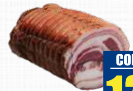
LARDERIA PANCETTA VERGAZZATA META'