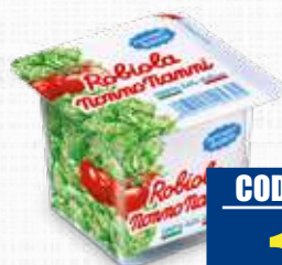
NONNO NANNI ROBIOLA 100 g