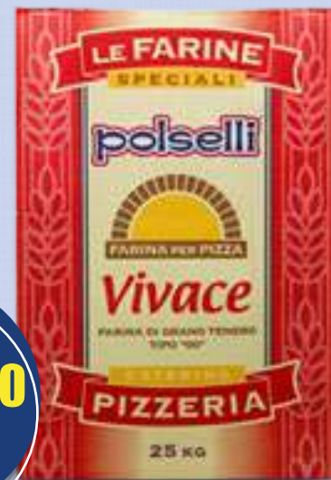
POLSELLI FARINA VIVACE ROSSA 25 Kg