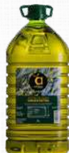
CASALBERT ALBERFRIT 10 l