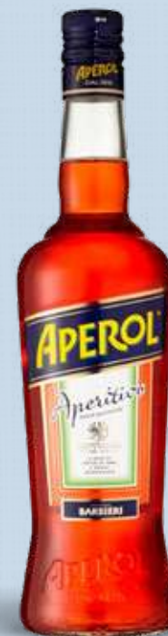
APEROL BARBERI 11% 1 l