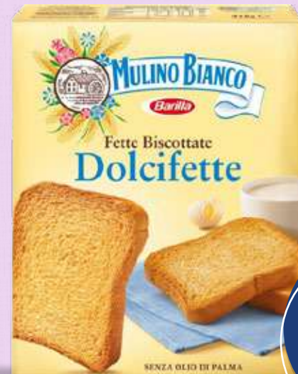
MULINO BIANCO DOLCIFETTE 315 g