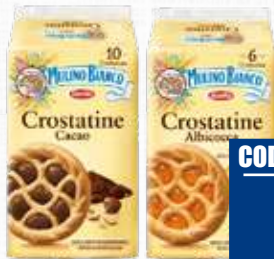
MULINO BIANCO CROSTATINA ALBICOCCA/ CROSTATINA CACAO 400 g