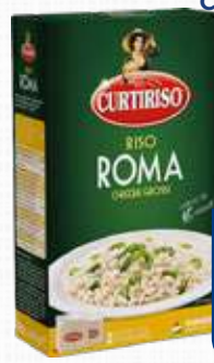
CURTI CURTIRISO ROMA 500 g