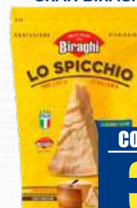
BIRAGHI GRAN BIRAGHI SPICCHIO 250 g