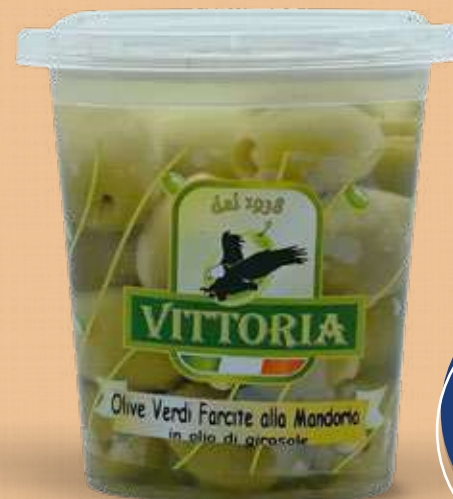
VITTORIA OLIVA RIPIENI MANDORLA IN OLIO 400 g