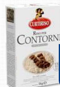
CURTI CURTIRISO PER CONTORNI 1 Kg