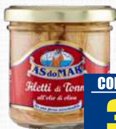
ASDOMAR TONNO A FILETTI IN OLIO D' OLIVA 150 g