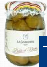
LA SORGENTE BABA' AL RHUM 500 g