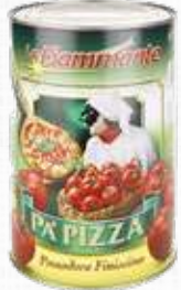
FIAMMANTE POLPA "PA PIZZA" 4 Kg