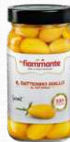
FIAMMANTE DATTERINI GIALLO 400 g