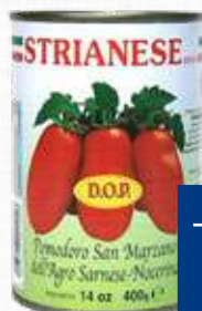
STRIANESE POMODORO S.MARZANO 400 g