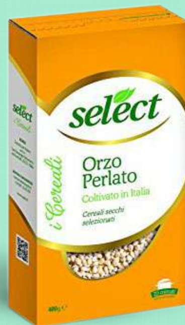
SELECT ORZO PERLATO 400 g