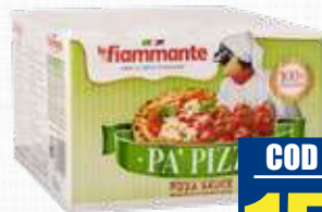
FIAMMANTE POLPA POMODORO BAG IN BOX 5 Kg