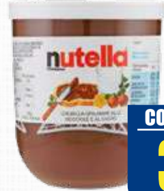
NUTELLA FERRERO BICCHIERE 220 g