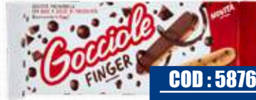
PAVESI GOCCIOLE FINGER 120 g