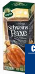
SENFTER STINCO 650 g