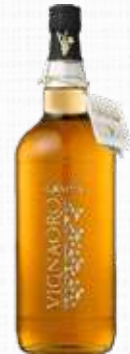
DESIRE GRAPPA VIGNA ORO SCURA 40% 1,5 l