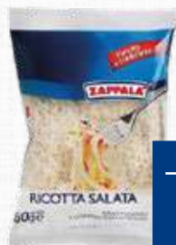
ZAPPALA RICOTTA SALATA GRATTUGIATO 80 g