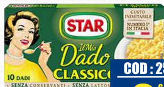
STAR DADO CLASSICO 100 g