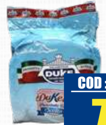
JUPPY PROSCIUTTO COTTO SCELTO "DUKET- TO" BOMBATO