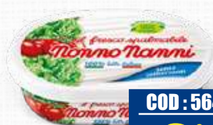
NONNO NANNI FRESCO SPALMABILE 150 g