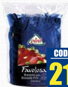
PINI BRESAOLA P.D'ANCA B: GOOD