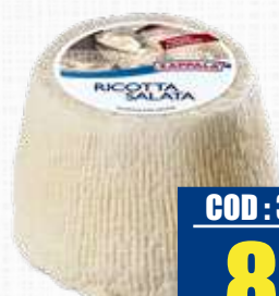
ZAPPALA RICOTTA SALATA 800 g