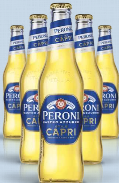
PERONI NASTRO AZZURRO BIRRA CAPRI STYLE 4,2% 33 cl