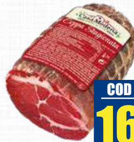
CASA MODENA COPPA PELATA