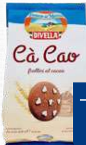
DIVELLA CA CAO AL CACAO 400 g