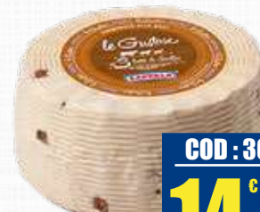
ZAPPALA LE GUSTOSE CON NOCI 800 g