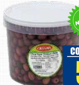
GRANATA OLIVE NERE DENOCCIOLATO 5 Kg