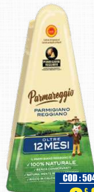
PARMAREGGIO PARMIGIANO 12 M. 150 g