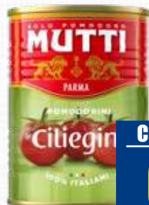
MUTTI POMODORO CILIEGINI 400 g