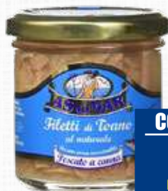
ASDOMAR TONNO A FILETTI AL NATURALE 150 g