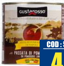
GUSTAROSSO PASSATA POMODORO 2,5 Kg