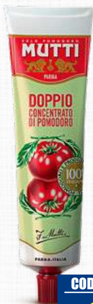
MUTTI DOPPIO CONCENTRATO POMODORO 130 g