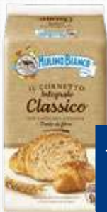
MULINO BIANCO CORNETTI INTEGRALI 240 g