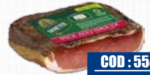
SENFTER SPECK ALTO ADIGE IGP 1/2