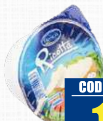
FRANCIA RICOTTA FRESCA 250 g