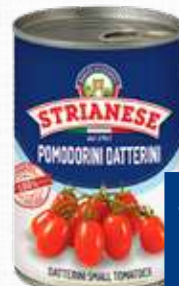
STRIANESE POMODORINI DATTERINI 400 g