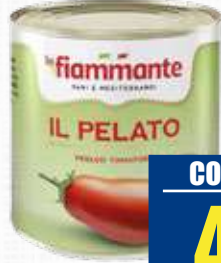
FIAMMANTE POMODORI PELATI 2,5 Kg