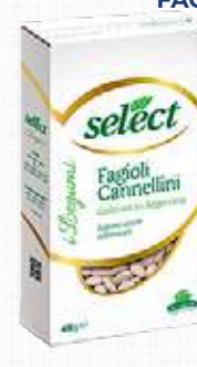
SELECT FAGIOLI CANNELLINI 400 g