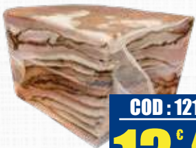
SALUMI CICCIOI NAPOLETANI 1/4 KG 5 Kg