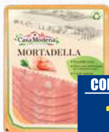
CASA MODENA MORTADELLA BIO IGP 100 g