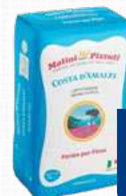
MOLINI PIZZUTTI FARINA COSTA D'AMALFI TIPO 0 25 Kg