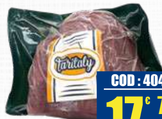
TARITALY CARPACCIO CARNE SALATA