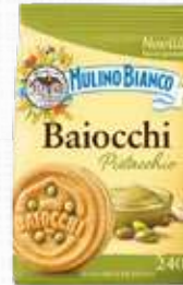
MULINO BIANCO BAIOCCHI PISTACCHIO 240 g