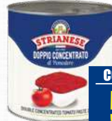
STRIANESE DOPPIO CONCENTRATO 2,2 Kg