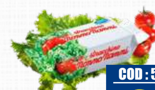
NONNO NANNI STRACCHINO 1 Kg