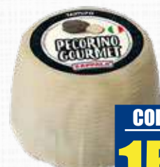
ZAPPALA GUSTOSE CON TARTUFO 800 g