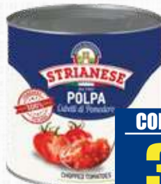
STRIANESE POLPA A DADINI 2,5 Kg